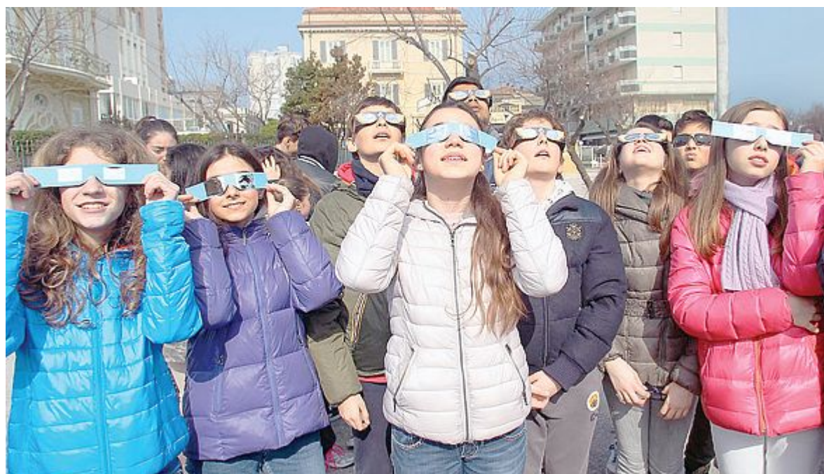
ORGANIZZATI Per poter vedere l'eclissi lenti e filtri di ogni tipo per riparare gli occhi dai raggi solari