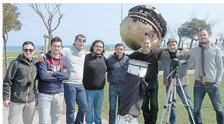
Il Gruppo astrofili pesarese si è messo a disposizione del pubblico ed ha seguito il fenomeno con i telescopi; gli astrofili sono arrivati in piazza della Libertà alle 8 per montare i loro strumenti